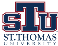
EXHIBIT HOURS Monday—Saturday 10:00 am—4:00 p.m. Sundays 12:00 noon-7:00 p.m.

St. Thomas University Library/Second Floor, 16401 NW 37th Avenue Miami Gardens, FL 33054 FOR MORE INFORMATION: (305) 628-6769